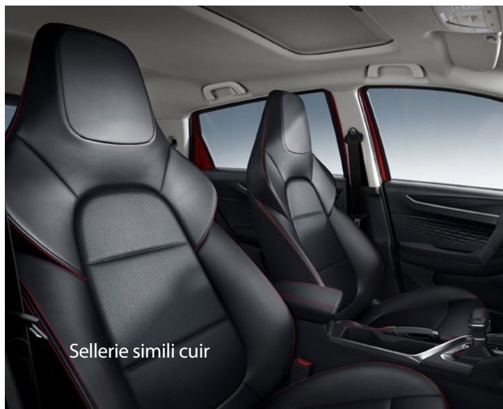
Sellerie simili cuir