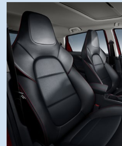
Sellerie simili cuir