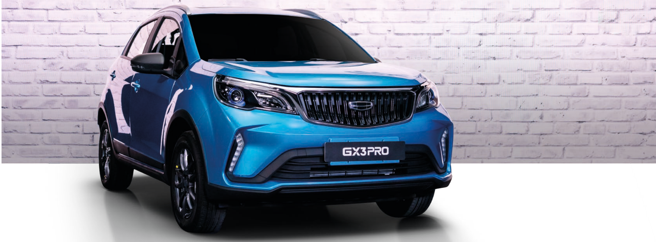
Feux de jour avant